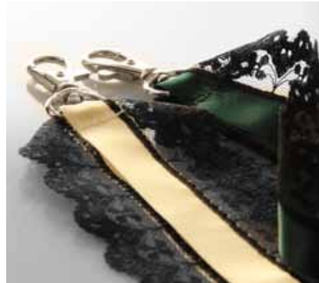
Sehr elegant & weiblich Der Nek-belt® - Elegancé

Das hochwertige Jacquardband lässt es zu, dass Ihre Werbung der Druckqualität ähnelt , obwohl es sich hierbei um eine hochwertige Einwebung handelt.